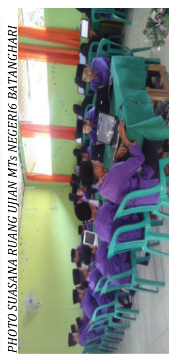
PHOTO SUASANA RUANG UJIAN MTs NEGERI6 BATANGHARI