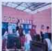
Peraturan XTRB Hasil Kerja dan Laporan, 28 Agustus 2024