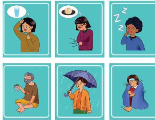
Lampiran 7.1 Kartu Kebutuhan Manusia