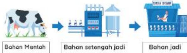
Gambar 7.1 Proses produksi pada susu cair

Proses kegiatan produksi memiliki 3 tahapan: