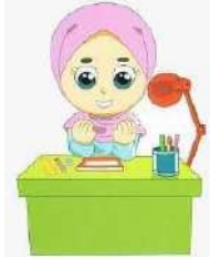
Ketika akan belajar