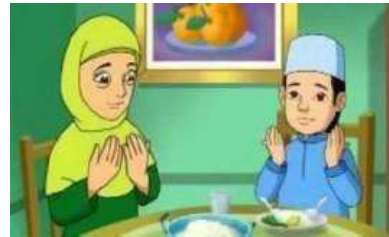
Ketika hendak makan atau minum