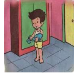
Ketika hendak berpakaian