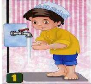
Ketika hendak berwudhu