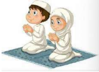
Ketika akan shalat dan berdoa