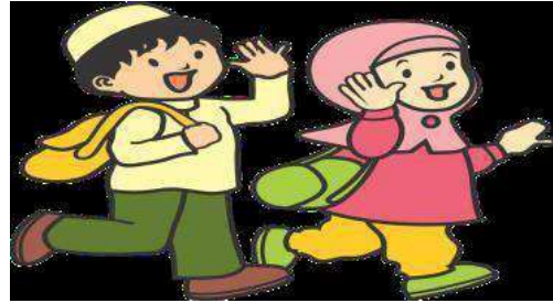
Ketika hendak bepergian atau berangkat sekolah